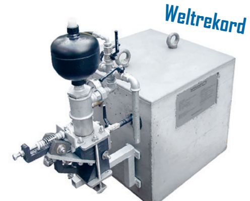
Kompakt-Widder für Förderhöhen bis 1000 m

Ein Kompakt-Widder schafft problemlos Förderhöhen von mehreren hundert Metern.